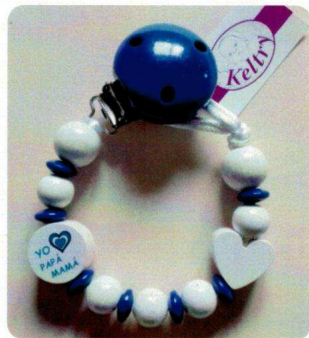
Yo Amo Azul