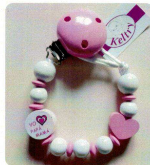
Yo Amo Rosa